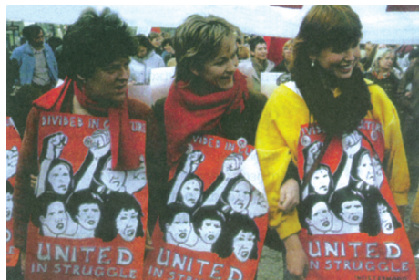
N.E. B' K. σ. 47.