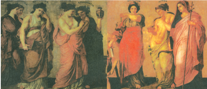
Απεικόνιση των Επιστημών (Ρητορική, Ποιητική, Μαθηματική, Ιστορία, Αρχαιολογία, Νομοθεσία, Ιατρική) Ν.Ε. Β' Κ., σ. 154.

Σχόλιο: Οι επιστήμες είναι γένους θηλυκού αλλά, ωστόσο, οι άνδρες προβάλλονται να τις θεραπεύουν και να διαπρέπουν σ' αυτές διαχρονικά.