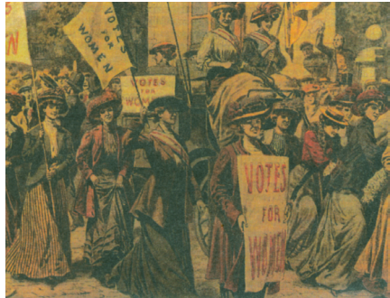
Οι σουφραζέτες διαδηλώνουν το 1908 στο Λονδίνο N.E. B' K., σ.66.

- «Πώς συμπεριφέρονται και αντιδρούν τα γυναικεία και αντρικά πρόσωπα που παρουσιάζονται στο αφήγημα;» (σ.149).