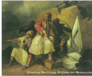
N.E. Β΄ Τάξη 1 ου Κ., σ.26.