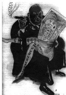
N.E. 2 ου Κ., σ. 101.

- Απαξιωτικά, άπρεπα και υβριστικά προβάλλονται να εκφράζονται η Λωξάντρα και η Ευτέρπη για τη νύφη τους, την Καμίλλη, η οποία είναι αδύνατη και ολιγόφαγη: «Φάτο, φάτο κακόν καιρό να μην έχεις... Φάτο, να πιάσει τ’ άντερό