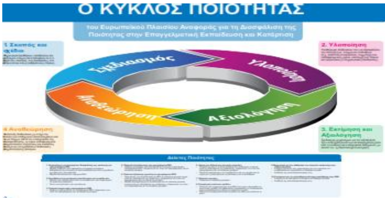
Σχήμα 1. Κοινό Μοντέλο Διασφάλισης της Ποιότητας/ Ο Κύκλος της Ποιότητας.

Τέλος, η μεγαλύτερη πρόκληση για την όλη διαδικασία είναι η ενημέρωση και η διάχυση των αποτελεσμάτων της αξιολόγησης στο ευρύ κοινό καθώς και ο διάλογος με τα ενδιαφερόμενα μέρη γύρω από τους παράγοντες που οδήγησαν σε συγκεκριμένα αποτελέσματα και τις δυνατότητες για μελλοντικές βελτιώσεις.