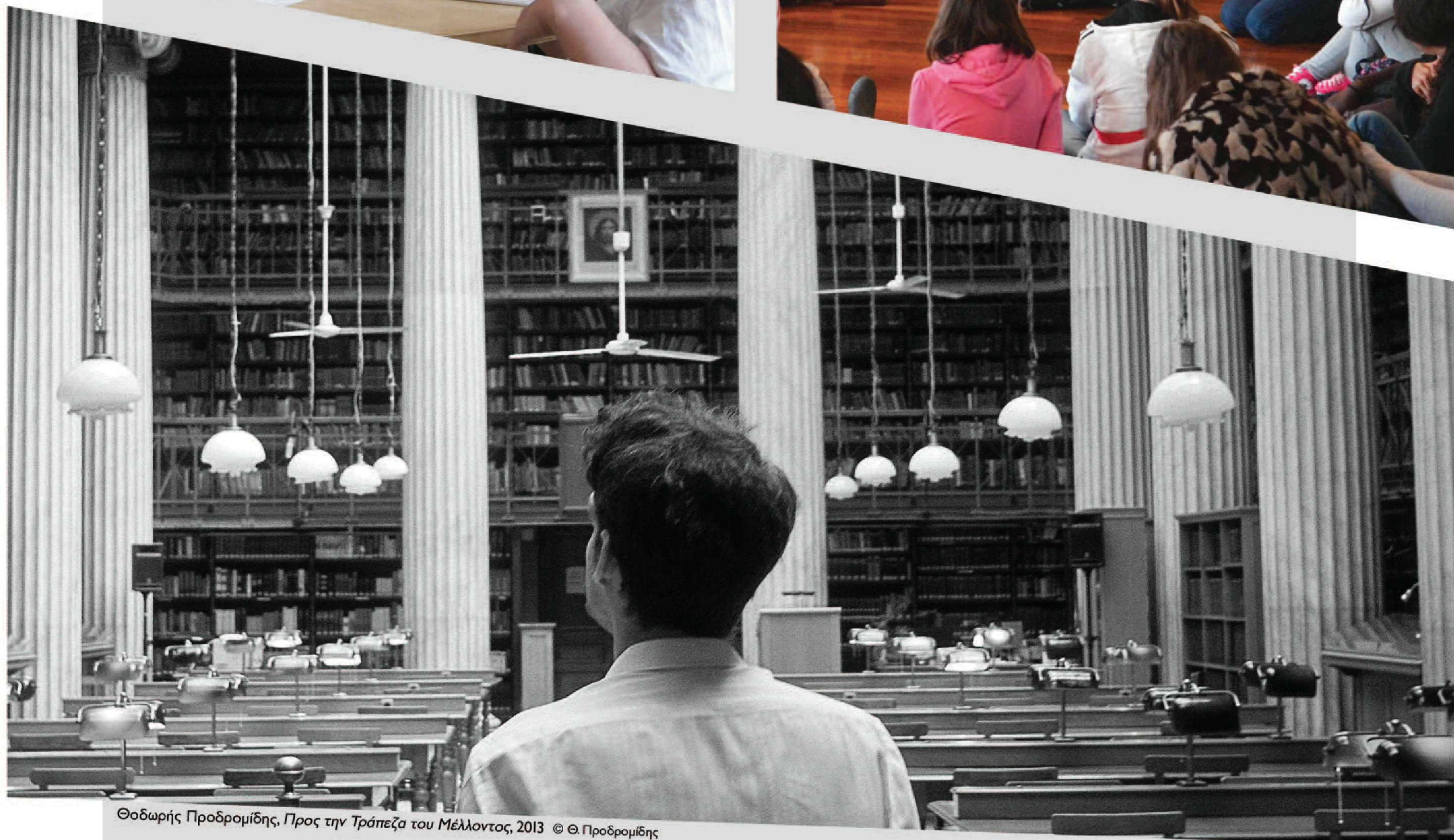
Θοδωρής Προδρομίδης, Προς την Τράπεζα του Μέλλοντος , 2013 © Θ. Προδρομίδης