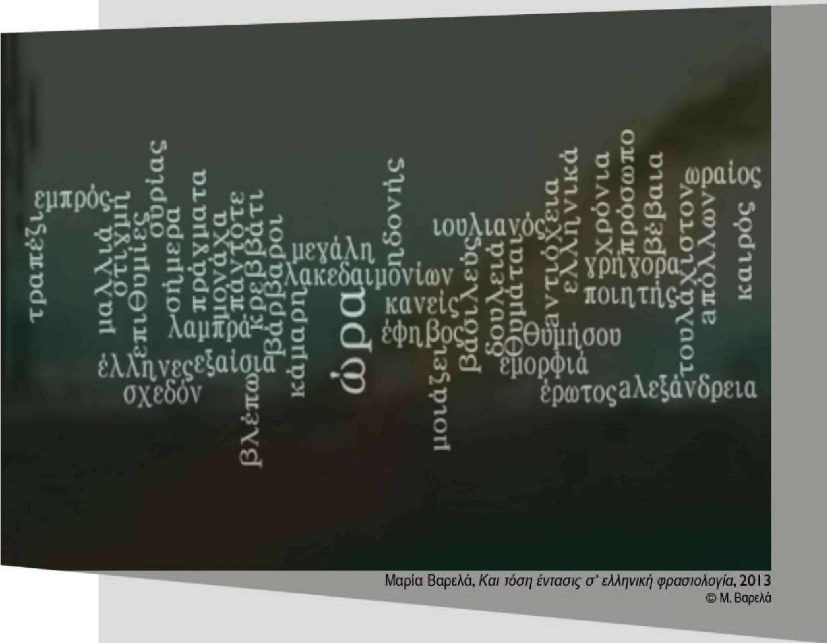
Μαρία Βαρελά, Και τόση έντασις σ' ελληνική φρασιολογία, 2013 © Μ. Βαρελά