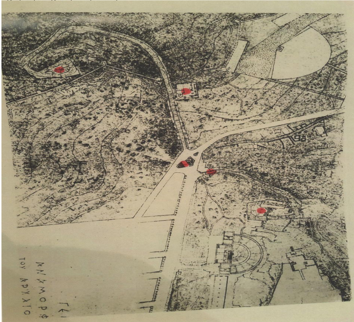
Σχέδιο του γύρω από την Ακρόπολη χώρου και του μνημείου Φιλοπάππου

Το έργο χωρίζεται σε πέντε " αρχιτεκτονικά θέματα " που θα είναι και πέντε σταθμοί του περιπάτου: στον κόμβο Πικιώνη, στο Λουμπαρδιάρη και στο Άνδηρο, στην αρχή και στο τέλος της πρόσβασης στην Ακρόπολη.