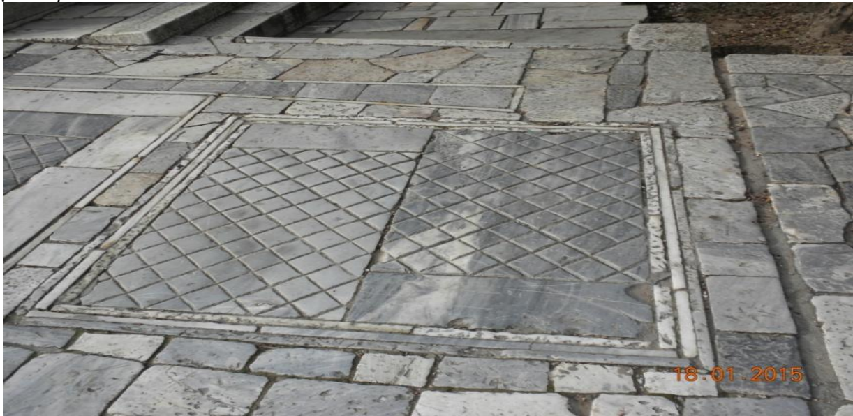
Χαρακτηριστικό σχέδιο τμήματος πλακόστρωτου

Η δομή στα πλακόστρωτα είναι πρωτότυπη. Συνδυάζονται ετερογενή υλικά από άποψη τεχνολογίας, όπως κυβόλιθοι και σκυρόδεμα. Τα δομικά υλικά και τα εργαλεία που χρησιμοποιήθηκαν, ήταν επιλεγμένα έτσι ώστε να φαίνεται το επιδέξιο χέρι του κτίστη-τεχνίτη-μάστορα.