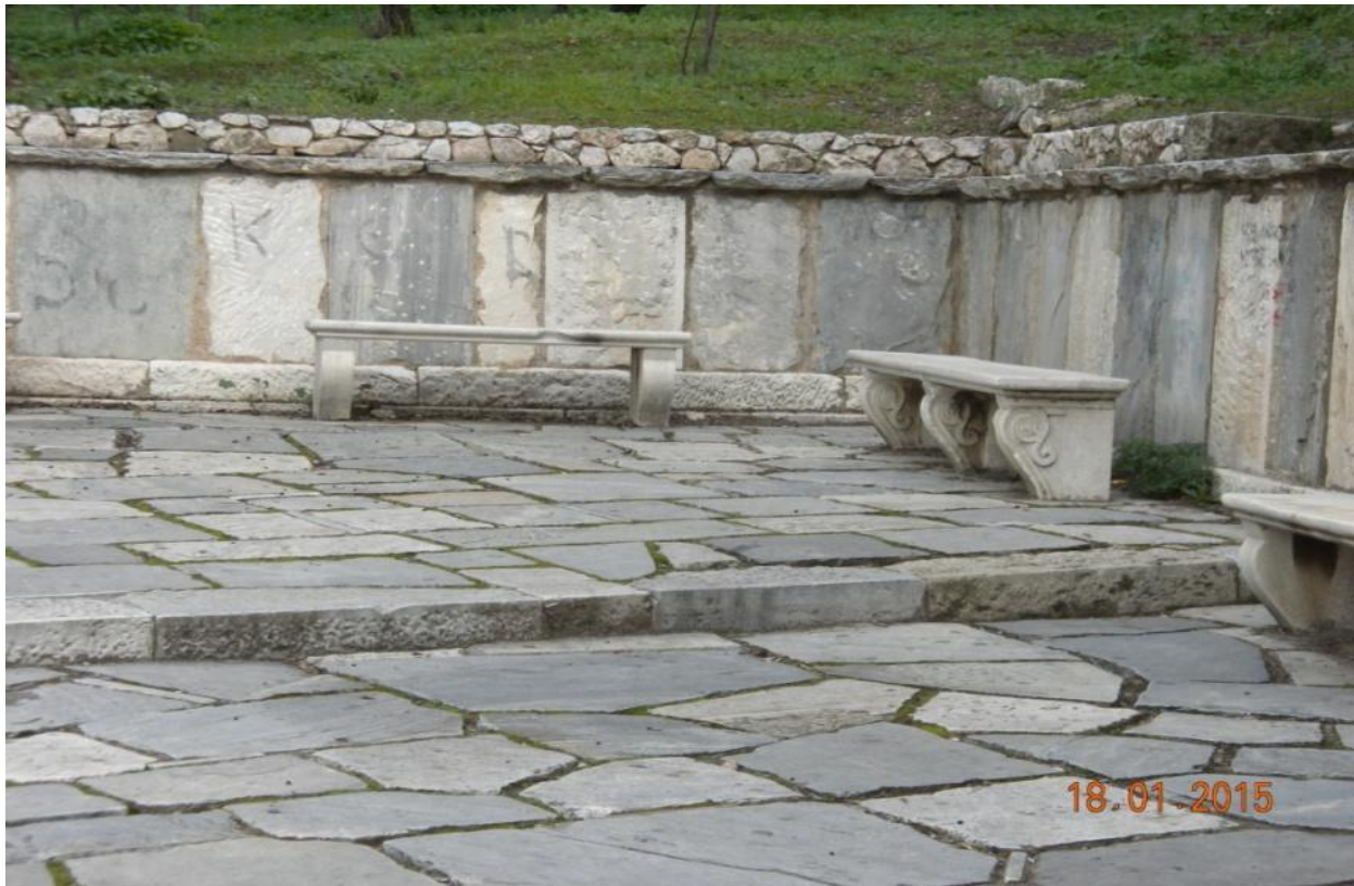
Η αρχή του μονοπατιού προς την είσοδο του αρχαιολογικού χώρου της Ακρόπολης

Η όλη περιοχή, που ανατέθηκε στον Πικιώνη προς διαμόρφωση, είναι περίπου 80.000 τ.μ., περίπου το 13% του συνόλου των ανοιχτών χώρων γύρω απ' την Ακρόπολη, εξαιρούμενων των περιφραγμένων αρχαιοτήτων. Η όλη ιδέα, δεν ήταν ιδέα αναπαλαίωσης ή αρχιτεκτονικής αναβίωσης του παρελθόντος, ούτε μίμηση αυτού. Ήταν έργο σύγχρονο, για την εξυπηρέτηση των τότε αναγκών και ως εκ τούτου εκφράζει τον τόπο και το χρόνο της δόμησης της. Εμπνευσμένο από την παράδοση: αρχαία, βυζαντινή, λαϊκή, σύγχρονη, και πλασμένο με πλούσια φαντασία. Είναι γνωστό από την εποχή που κτίστηκαν τα Προπύλαια, ότι το λειτουργικό έργο υποτάσσεται στο μνημειακό . Γι' αυτό και ο Πικιώνης ήθελε να δώσει σεμνή έκφραση στο έργο του και να το υποτάξει στο τοπίο και την ιστορία του. Εφάρμοσε αρχιτεκτονικά τις γωνιακές χαράξεις από το πλακόστρωτο της αυλής του Άγιου Δημήτριου του Λουμπαρδιάρη και του Άνδηρου θέας προς την Ακρόπολη, στη ράχη του Φιλοπάππου και προσπάθησε να προσεγγίζει τις ερμηνείες των αυθεντικών περί αρμονίας διατυπώσεων των πυθαγορείων και ιδιαίτερα του μαθηματικού της αρχαιότητας Νικόμαχου, στους οποίους βάσιζαν όλοι οι σύγχρονοι ερευνητές τις θεωρίες τους.