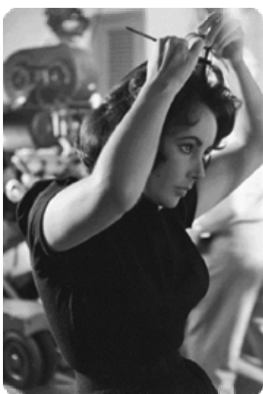
Ελίζαμπεθ Τέιλορ (όταν ήταν 53 χρόνων)

«Νομίζω ότι επιτέλους αρχίζω να μεγαλώνω. Καιρός δεν ήταν;»