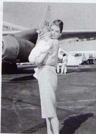
Η Οντρεϊ Χέμπμπορν και ο επτά μηνών Σον ετοιμάζονται να πετάξουν για Ρώμη (1961) Κάτω: Στα παιδιά της Αιθιοπίας έδωσε και την ψυχή της (1988)

Η Οντρεϊ άφησε την τελευταία της πνοή στις 20 Ιανουαρίου 1993 σε νοσοκομείο της Ελβετίας: είχε μεταβεί εσπευσμένως από το Λος Αντζελες στη χιονισμένη έπαυλή της, διότι εκεί ήθελε να γιορτάσει τα 63α γενέθλιά της. Το τζετ ανήκε σε φίλο του πιστού της φίλου Υμπέρ ντε Ζιβανσί. «Υπήρξες τα πάντα στη ζωή μου» της είχε πει κατά την τελευταία τηλεφωνική συνομιλία τους. Και το εννοούσε. Επί σαράντα χρόνια η Οντρεϊ Χέμπμπορν ενέπνεε τις συλλογές του γάλλου σχεδιαστή. Αυτός την έντυνε, τόσο στις ταινίες όσο και στις επίσημες εμφανίσεις της, ενώ το πρώτο του γυναικείο άρωμα, L' Interdit, σε εκείνη το είχε αφιερώσει. Στην πιο όμορφη, ευγενική και «αθλητική» γυναίκα που είχε γνωρίσει ποτέ. ●