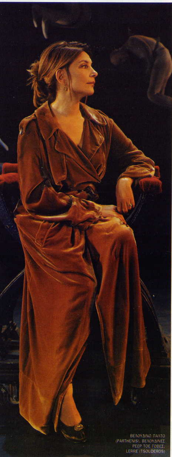
ΒΕΛΟΥΔΙΝΟ ΠΑΤΟ (PARTHEMIS), ΒΕΛΟΥΔΙΝΕΣ PFEF TOE TOBEE, LERRE (TSOLDEROS)

της ζωής. Οι περισσότεροι ζουν μια καθημερινότητα αδυσώπητη. Η ζωή είναι πολύ σκληρή».