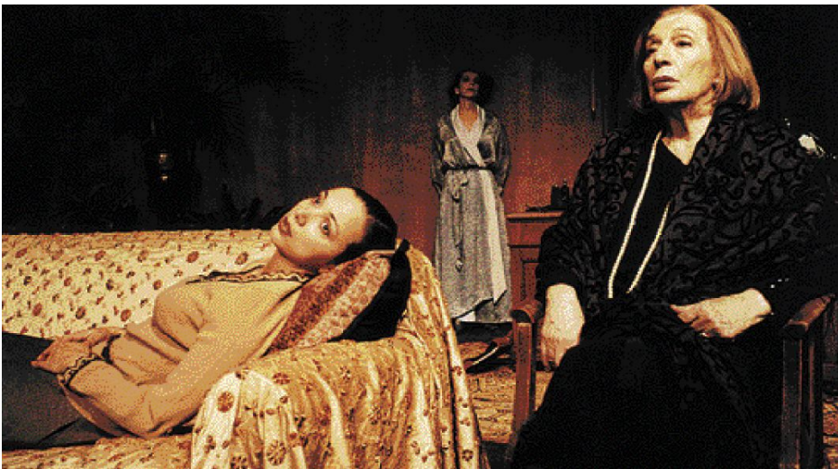
Από την τελευταία θεατρική εμφάνισή της στην «Κυρία Κλάιν» στο Θέατρο Εξαρχείων, με τη Χριστίνα Αλεξανιάν και στο βάθος την Αννίτα Δεκαβάλλα

Η Ελένη Χατζηαργύρη, που έφυγε από τη ζωή το πρωί της περασμένης Παρασκευής, ήταν μία από εκείνες τις ελάχιστες γυναίκες που ήξεραν να συνδυάζουν την τέχνη με τη ζωή. Έχοντας συμπληρώσει έξι δεκαετίες στο θέατρο, έχοντας ερμηνεύσει «όλους» τους ρόλους, παρέμεινε ένας άνθρωπος γεμάτος ενδιαφέροντα για τα μικρά και τα μεγάλα, μια ξεχωριστή Δασκάλα. Δύσκολα να σκεφθεί κανείς το θέατρο χωρίς την παρουσία της στο σανίδι ή στην πλατεία, αφού παρακολουθούσε παραστάσεις όποτε δεν έπαιζε η ίδια. Το 2004 το Πανεπιστήμιο Αθηνών της επεφύλαξε τη μέγιστη τιμή: να είναι η πρώτη ηθοποιός που αναγορεύθηκε επίτιμη διδάκτωρ. Η ίδια είχε εκφράσει πολλές φορές τις σκέψεις της σε συνεντεύξεις που είχε παραχωρήσει τα τελευταία χρόνια στο «Βήμα», αποσπάσματα των οποίων παραθέτουμε.