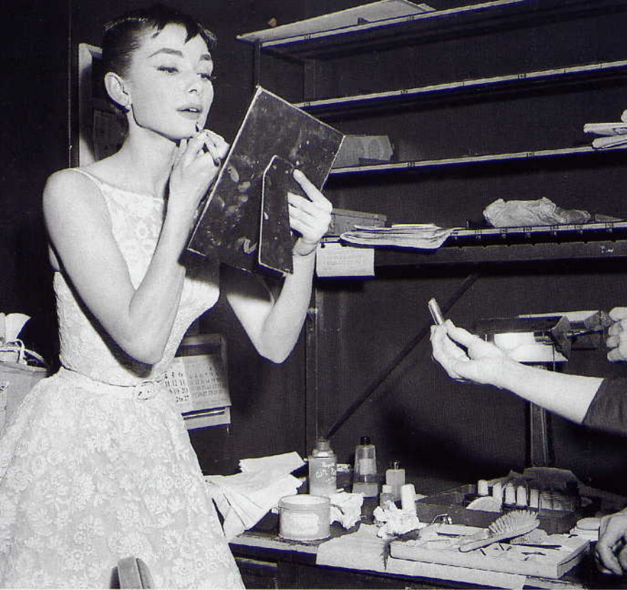
Η Οντρέϊ Χέιμμπορν-Νατάσα και ο Χένρι Φόντα-Πιερ, στην κινηματογραφική μεταφορά του μυθιστορήματος του Λέοντος Τολστόι «Πόλεμος και ειρήνη» (1955) Αριστερά: Κραγιόν στα πεταχτά, λίγο πριν από την παραλαβή του Όσκαρ Α΄ γυναικείου ρόλου (1954)