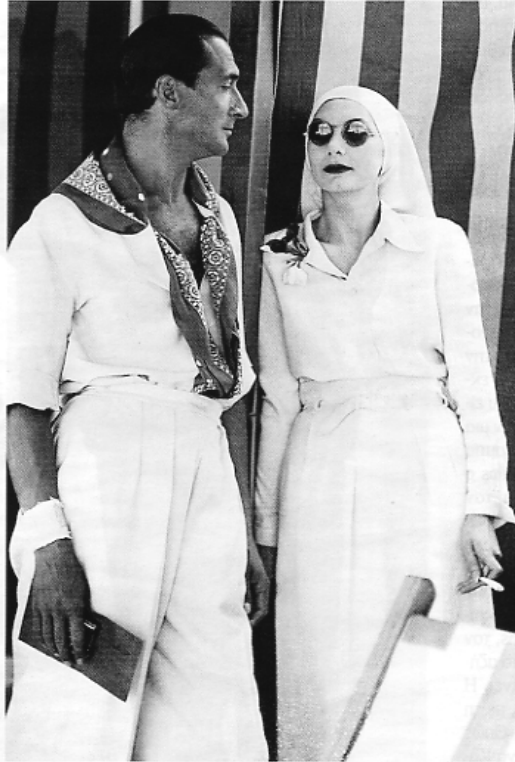
ΤΟ 1935 ΣΤΟ ΛΙΝΤΟ (κοντά στη Βενετία), η Γκάρμπο φορώντας τα περίφημα μαύρα γυαλιά της συναντά τον ιταλό ηθοποιό του θεάτρου Νέριο Μπερνάρντι

εκτοξεύει συνεχώς τα επόμενα δεκαπέντε χρόνια: «Θα γυρίσω στη Σουηδία». Αρκεί αυτό για να δεχτούν τα στούντιο ό,τι ζητήσει. Ικανοποιούν όλες τις εκκεντρικότητές της. Είναι πολλές. Πρώτα απ' όλα