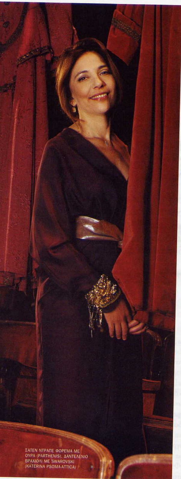
ΣΑΤΕΝ ΝΤΡΑΠΕ ΦΟΡΕΜΑ ΜΕ ΟΥΡΑ (PARTHENIS), ΔΑΝΤΕΛΕΝΙΟ ΒΡΑΧΙΟΛΙ ΜΕ SWAROVSKI (KATERINA PSOMA-ATTICA)

«Ο ΑΝΘΡΩΠΟΣ ΠΟΥ ΑΠΟΦΑΣΙΖΕΙ ΝΑ ΑΣΧΟΛΗΘΕΙ ΜΕ ΤΗΝ ΤΕΧΝΗ ΕΧΕΙ ΕΝΑ ΕΓΩ ΡΑΓΙΣΜΕΝΟ, ΧΡΕΙΑΖΕΤΑΙ ΜΕΓΑΛΥΤΕΡΗ ΕΠΙΒΕΒΑΙΩΣΗ ΑΠΟ ΟΛΟΥΣ ΤΟΥΣ ΑΛΛΟΥΣ»