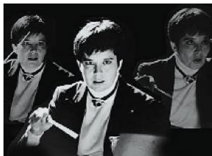
Η Κάρεν Κέλνερ, που εμφανίζεται τακτικά στο πόντιουμ της όπερας του Σαν Ντιέγκο, της Πόλης της Νέας Υόρκης, της Καρολίνας, του Σινσινάτι, του Πίτσμπουργκ και του Σιάτλ