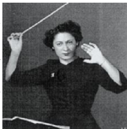
Η Έθελ Σταρκ, μία από τις πρωτοπόρους του πόντιουμ στον αιώνα μας, ίδρυσε το 1940, τη Συμφωνική Ορχήστρα Γυναικών του Μόντρεαλ

Όσπου η Αντόνια Μπρίκο κατάφερε στα 28 της να διευθύνει, πρώτη, την περίφημη Φιλαρμονική του Βερολίνου, το 1939 (είχε στο μεταξύ ιδρύσει και τη Συμφωνική Ορχήστρα Γυναικών της Νέας Υόρκης) και να προσκληθεί από πολλές ανδρικές ορχήστρες.