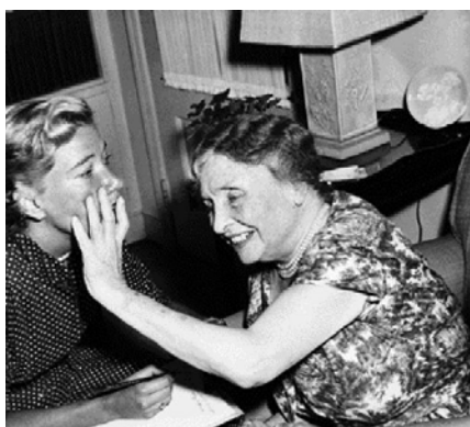
Η Έλεν Κέλερ ψηλαφεί το πρόσωπο της δημοσιογράφου Φίλις Μπατέλ, κατά τη διάρκεια συνέντευξης, την 21η Ιουνίου 1955

Όταν ήταν 19 μηνών, η Έλεν Άνταμς Κέλερ προσβλήθηκε από μια ασθένεια που την άφησε τυφλή και κωφάλαλη. Στα έξι της χρόνια την εξέτασε ο Αλεξάντερ Γκράχαμ Μπελ και την έστειλε σε μια δασκάλα από το Ίδρυμα Perkins της Βοστώνης, ονόματι Ανν Σάλιβαν Μείσι. Μέσα σε λίγους μήνες η μικρή Έλεν είχε μάθει να ψηλαφεί αντικείμενα και να τα συνδέει με λέξεις, τις οποίες σχημάτιζε γράφοντας πάνω στην παλάμη της. Η Σάλιβαν, αξιοθαύμαστη δασκάλα, πέτυχε να αποκαταστήσει την επαφή του μικρού κοριτσιού με τον κόσμο. Ανάμεσα στο 1888 και στο 1890, η Έλεν Κέλερ ξεκίνησε την επίπονη προσπάθεια να μιλήσει, με δασκάλα τη Σάρα Φούλερ, στη Σχολή Κωφών Horace Mann. Το 1900 έγινε δεκτή στο Radcliffe College, από όπου αποφοίτησε μετ' επαίνου το 1904. Έχοντας αναπτύξει ικανότητες που κανένα άτομο με παρόμοια προβλήματα δεν είχε καν ονειρευτεί πριν από αυτήν, η Έλεν Κέλερ άρχισε να γράφει για την αναπηρία και να υποστηρίζει την ανάγκη για κοινωνική βελτίωση. Εκτός από τα ειδικά προβλήματα όσων αντιμετώπιζαν αναπηρία όμως, η Κέλερ είχε πολλά να πει και για τα ευρύτερα κοινωνικά προβλήματα της εποχής της. Το 1913 άρχισε να δίνει διαλέξεις - πάντα με τη βοήθεια διερμηνέα - όπως αυτή που δημοσιεύουμε σήμερα. Εκφωνήθηκε στο Carnegie Hall της Νέας Υόρκης, στις 5 Ιανουαρίου 1916.