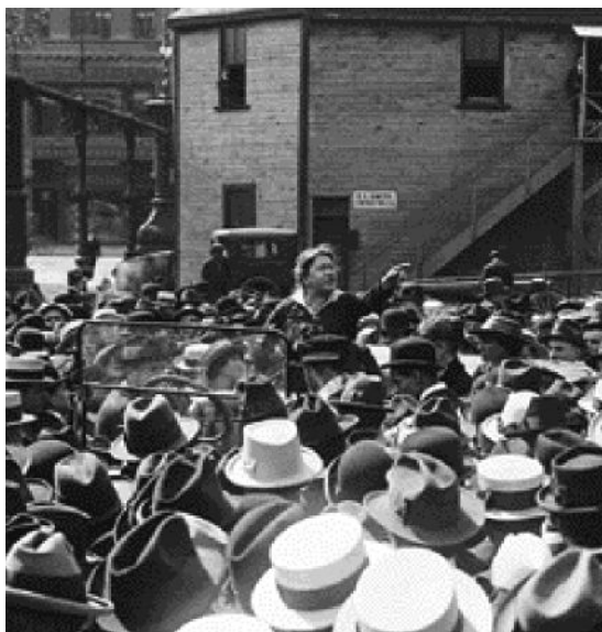
Η Έμα Γκόλντμαν μιλάει στο πλήθος για την αντισύλληψη, στη Νέα Υόρκη, την 21η Μαΐου 1916