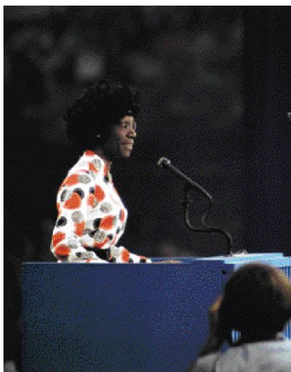
Η βουλευτής Σίρλεϊ Τσίζχολμ στο Εθνικό Συνέδριο των Δημοκρατικών, στη Φλόριδα, το 1972

Μία από τις πιο σημαντικές και αποτελεσματικές υπερμάχους των δικαιωμάτων της γυναίκας, η Σίρλεϊ Τσίζχολμ εξελέγη στη Βουλή των Αντιπροσώπων των Ηνωμένων Πολιτειών το 1968. Γρήγορα έγινε γνωστή ως δυναμική φιλελεύθερη, η οποία αντιτάχθηκε στην εξοπλιστική πολιτική και στον Πόλεμο του Βιετνάμ. Ως υποψήφια για το προεδρικό χρίσμα των Δημοκρατικών, το 1972, κέρδισε την υποστήριξη πενήντα δύο αντιπροσώπων, προτού αποσυρθεί. Η Σίρλεϊ Τσίζχολμ, κατά τη διάρκεια της σταδιοδρομίας της στο Κογκρέσο των ΗΠΑ από το 1968 ως το 1983, υποστήριξε το γυναικείο κίνημα και την Τροπολογία των Ίσων Δικαιωμάτων καθώς και τη νομιμοποίηση των αμβλώσεων. Τον λόγο που δημοσιεύουμε σήμερα τον εκφώνησε ενώπιον της Βουλής των Αντιπροσώπων, στις 21 Μαΐου 1969.